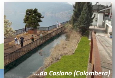
...da Caslano (Colombara)