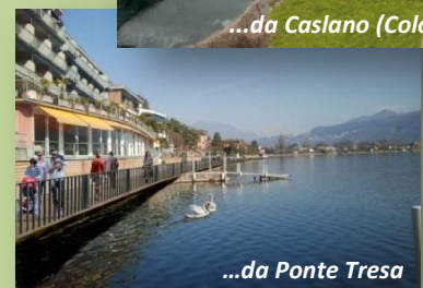
...da Ponte Tresa